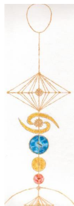
L'Arbre de Vie

Pour contacter l'auteur ou commander la méthode complète d'activation :